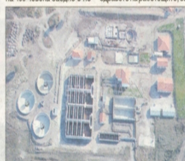
Пречиствателната станция край Димитровград

Обектът, с който най-много се гордее екипът на „ЕЛТЕ Инженеринг“, е построяването на ветроенергийния парк „Св. Никола“ край Каварна, с възложител