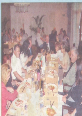
Екипът на „ЕЛТЕ Инженеринг“ със свои бизнеспартньори

тел AES GEO Energy. По договор обектът трябва да бъде приключен за 8 месеца, но „ЕЛТЕ Инженеринг“ успява да предаде площадката 2 месеца предсрочно. За това време фирмата изгражда 42 километра пътища, 65 километра кабелни канали, като полага в тях оптични кабели и електрозахранващи кабели средно напрежение. Издига 52 фундамента, всеки от които поема 720 кубически метра бетон и 61 тона арматурно желязо. Към всеки от фундаментите се изграждат и кранови площадки, на които сълват 1000-тонни кранове, за да монтират високите 100 метра турбогенераторни съоръжения. Всичко това фирмата постига с професионалната работа и разумно управление на 400 човека заедно с по-